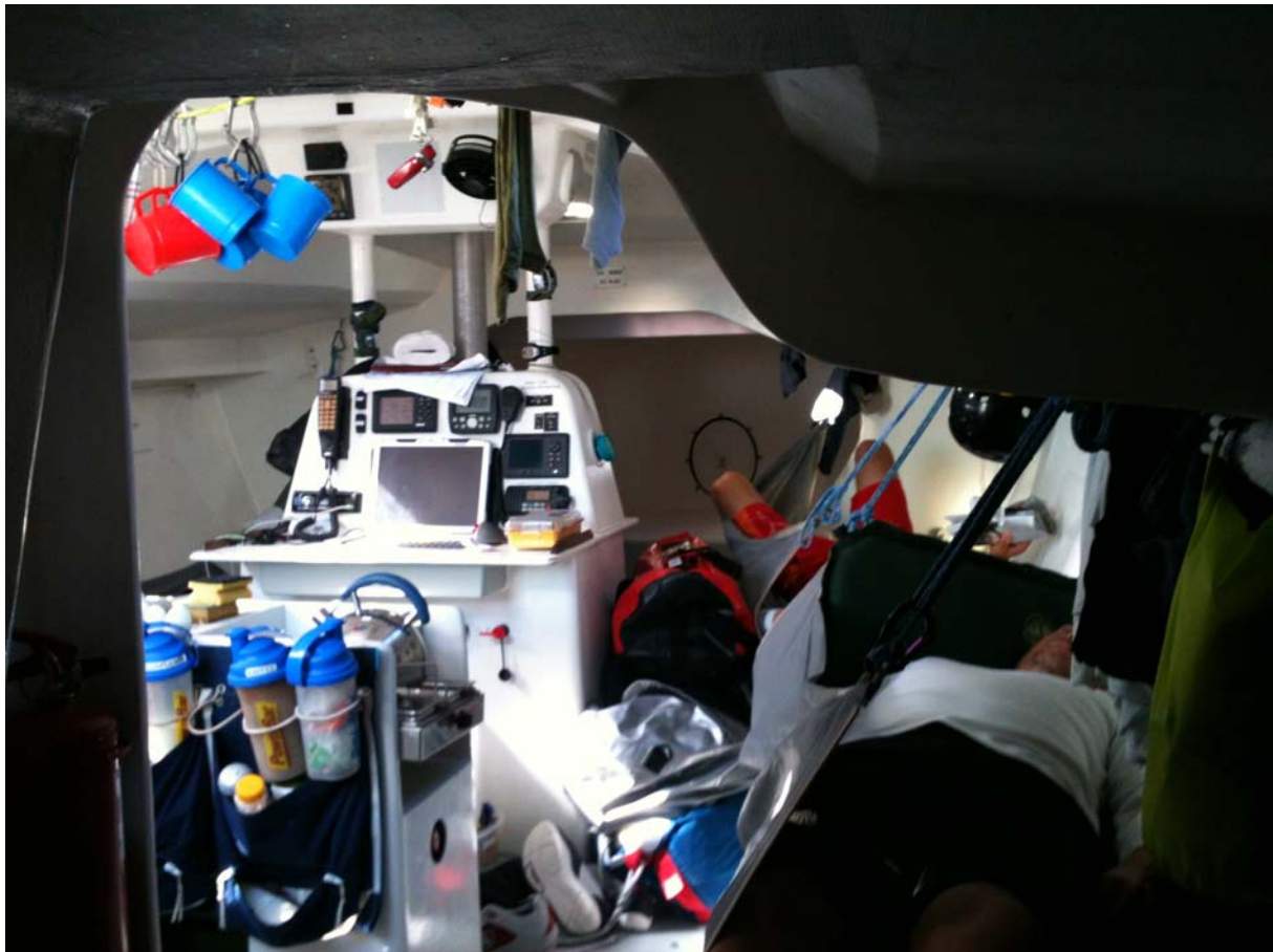
Bild: Der Raum unter Deck samt Einflammengaskocher Navigationsstation und zwei Schläfern.